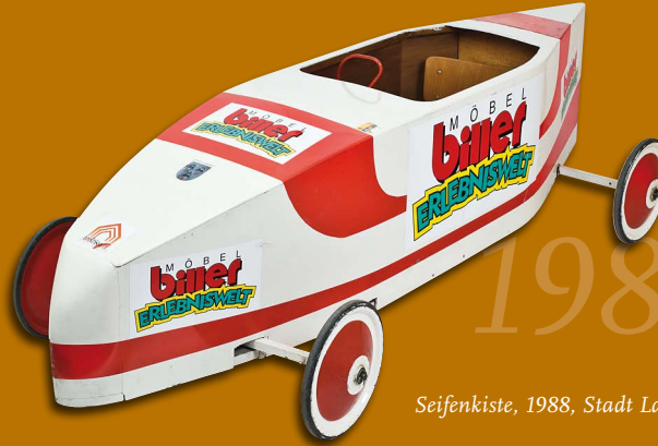
Seifenkiste, 1988, Stadt Landshut