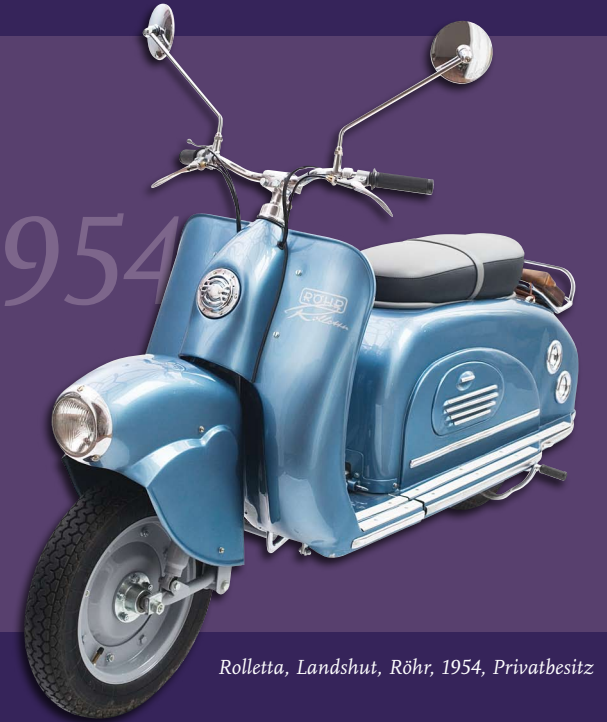
Rolletta, Landshut, Röhr, 1954, Privatbesitz