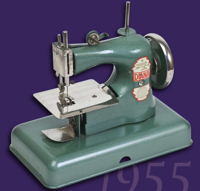
Kindernähmaschine, 1955, Museen der Stadt Landshut