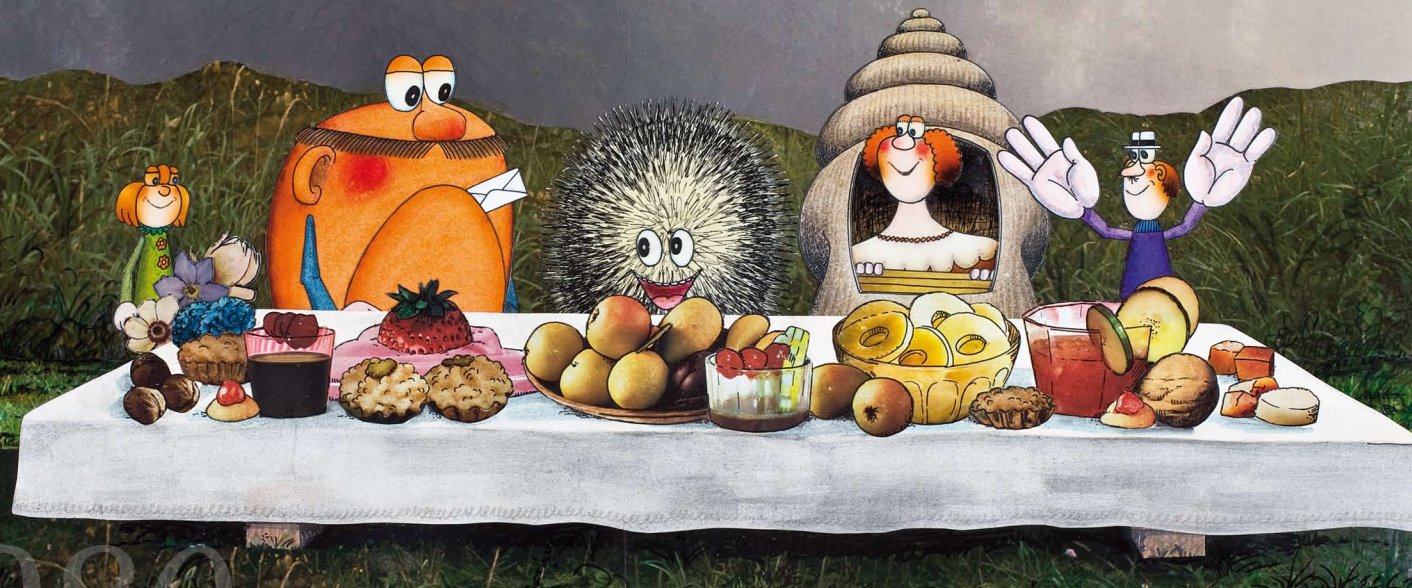
Einladung zum Gartenfest, 1980, J. W. Habarta, Zeichentrickfilm, Vorlage